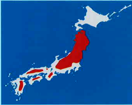
あも青生育可能ゾーン(北海道・赤塗り部を除く)

暖地型イネ科草種である。ハワイ、南太平洋サモア島、カロリン諸島、グアム島の海岸地帯に分布し、日本ではサワズメノヒユとよぶ。イネ科草種の中で最も耐塩性が強く、普通の淡水でも生育するが、10,000ppm以上の塩分を含む水でも生育すると報告されている。塩水を含む湖や沼の堤防の土壌保全に用いる。