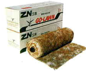
あも青ゴーローン

あも青の植付適期は、4月下旬から7月中旬です。適期以外の施工について、当社は一切の責任を負いかねます。栽培面積に限りがあります。早めにご予約ください。