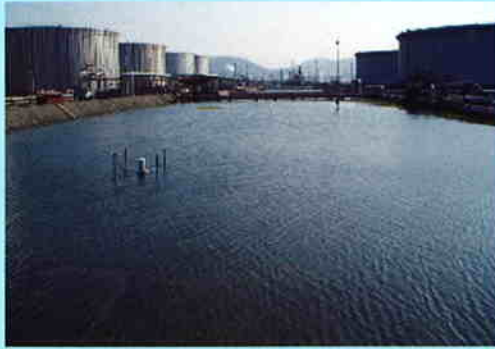
10月20日 台風23号の降雨で水没

あも青は、排水の悪い場所や水につかってしまうような場所でも生育することが可能です。