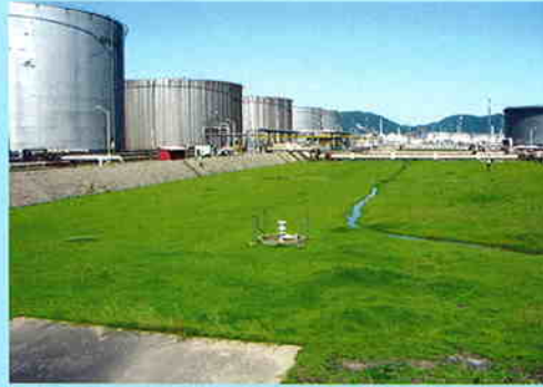
11月8日 19日間の冠水後