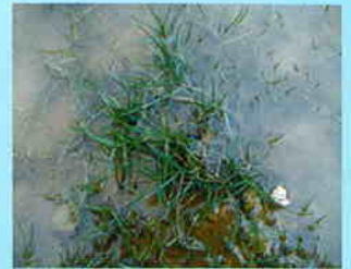
冠水状態のあも青